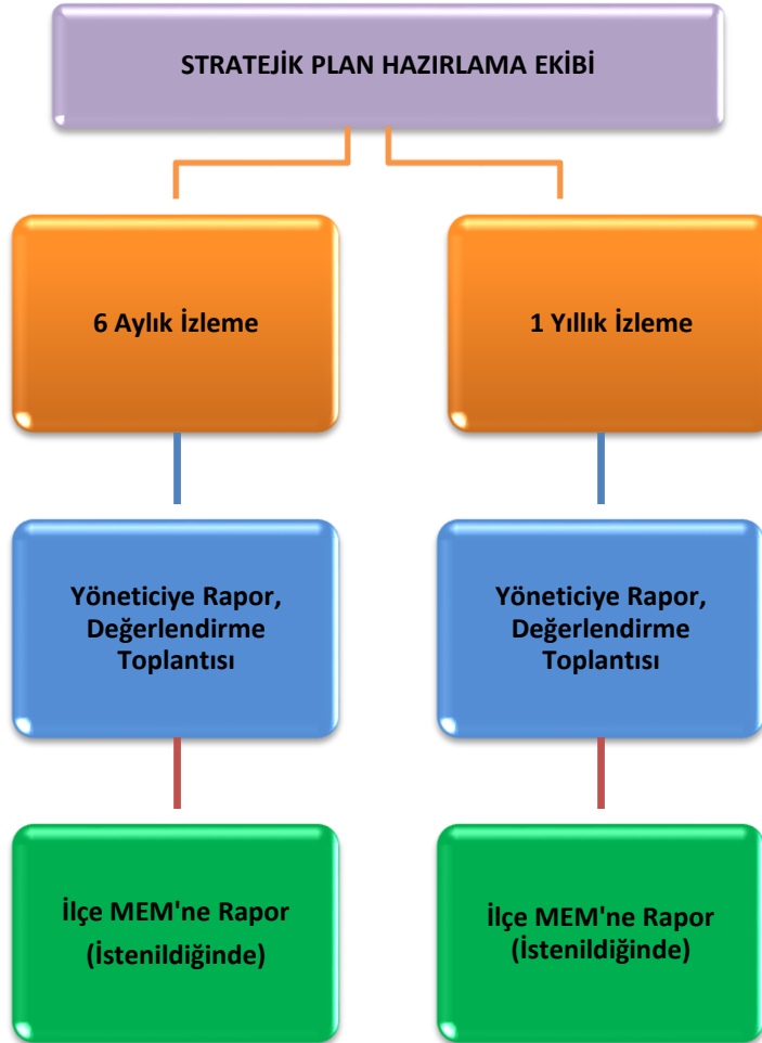
Şekil 3: İzleme ve Değerlendirme Süreci

Müdürlüğümüzün 2019-2023 Stratejik Planı İzleme ve Değerlendirme sürecini ifade eden İzleme ve Değerlendirme Modeli hazırlanmıştır. Okulumuzun Stratejik Plan İzleme-Değerlendirme çalışmaları eğitim-öğretim yılı çalışma takvimi de dikkate alınarak 6 aylık ve 1 yıllık sürelerde gerçekleştirilecektir. 6 aylık sürelerde Okul Müdürüne rapor hazırlanacak ve değerlendirme toplantısı düzenlenecektir. İzleme-değerlendirme raporu, istenildiğinde İlçe Milli Eğitim Müdürlüğüne gönderilecektir.